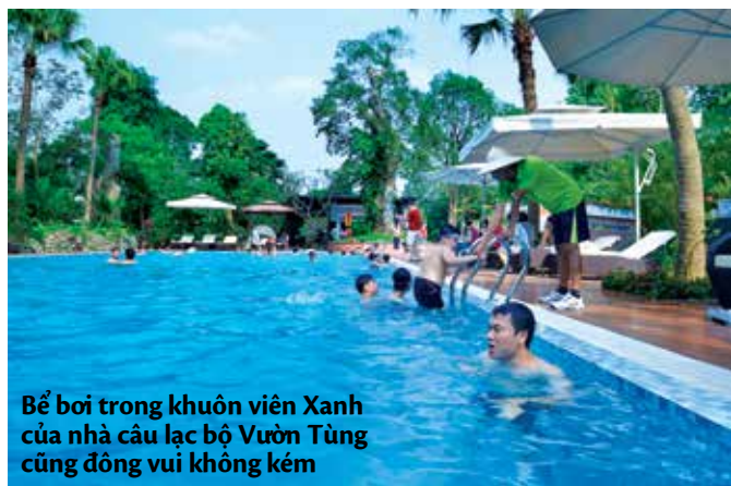
Bể bơi trong khuôn viên Xanh của nhà câu lạc bộ Vườn Tùng cũng đông vui không kém

Mời độc giả cùng chiêm ngưỡng những hình ảnh đẹp của khu du lịch trong những ngày nghỉ dịp 30.4-1.5 vừa qua. Và xin hẹn gặp lại du khách trong những sự kiện tiếp theo sẽ được tổ chức thường xuyên tại Ecopark.