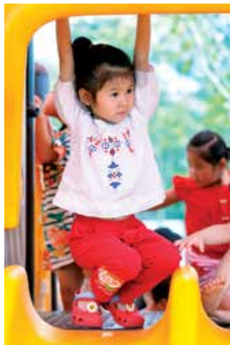
Các bé đặc biệt thích thú với các tiết mục biểu diễn của liên đoàn Xiếc Trung Ương