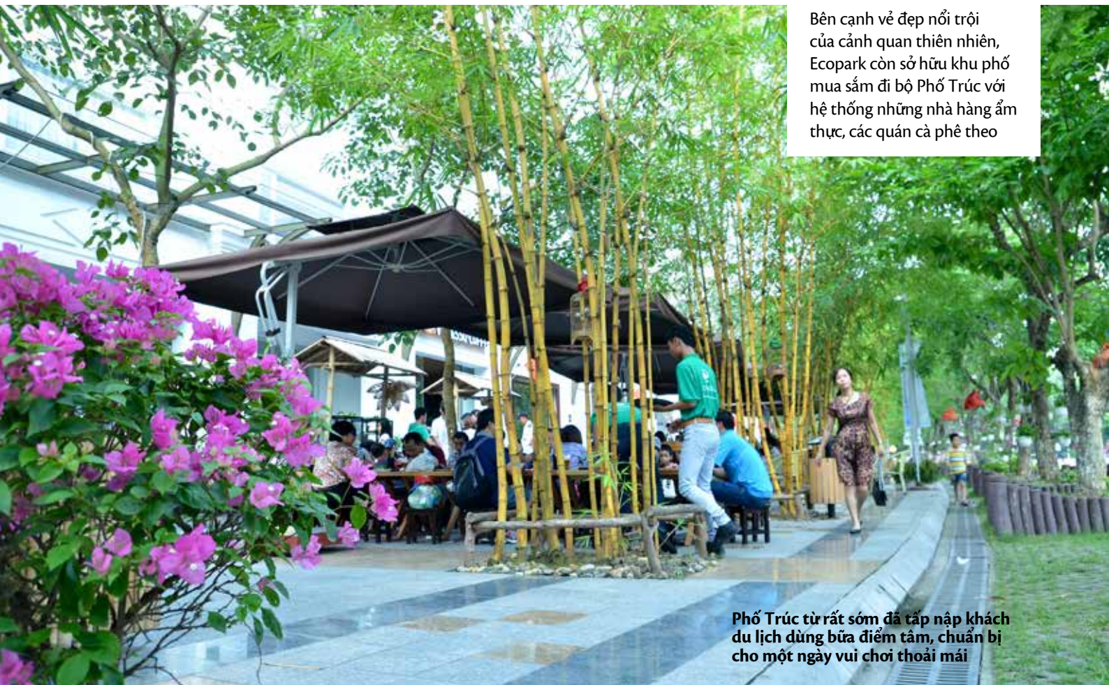
Phố Trúc từ rất sớm đã tập nập khách du lịch dùng bữa điểm tâm, chuẩn bị cho một ngày vui chơi thoải mái

Bên cạnh vẻ đẹp nổi trội của cảnh quan thiên nhiên, Ecopark còn sở hữu khu phố mua sắm đi bộ Phố Trúc với hệ thống những nhà hàng ẩm thực, các quán cà phê theo