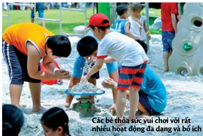
Các bé thỏa sức vui chơi với rất nhiều hoạt động đa dạng và bổ ích

phong cách độc đáo, chuỗi cửa hàng thủ công mỹ nghệ, đồ lưu niệm tinh xảo, đẹp mắt. Trong khuôn viên khu đô thị, các khu vực tiện ích khác như bể bơi, sân tennis, phòng tập gym, sauna, khu nhà câu lạc bộ đã đưa vào sử dụng với chất lượng dịch vụ tốt, tương đương với những khu nghỉ dưỡng đẳng cấp. Tất cả hội tụ tạo thành một điểm du lịch đa năng chỉ cách nội đô khoảng 20 phút lái xe, khiến du khách không khỏi