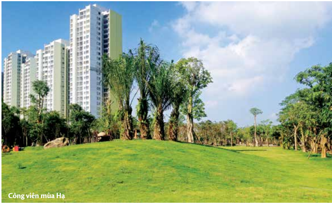
Công viên mùa Hạ